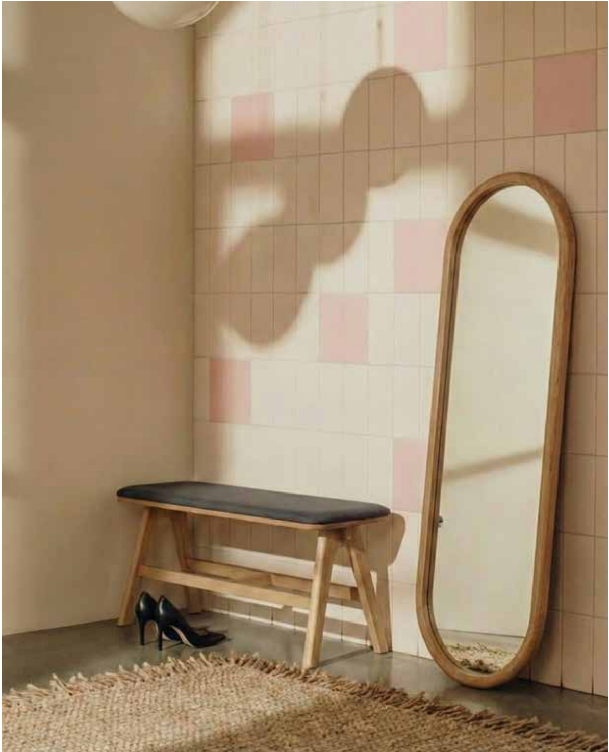
Banc Chevron Chêne naturel Tissu