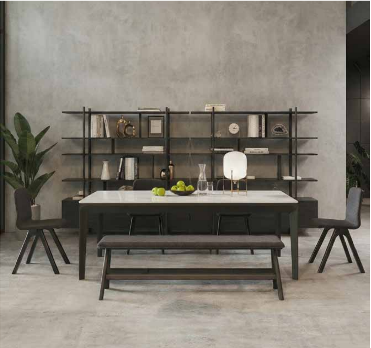
Banc Chevron Chêne anthracite Tissu