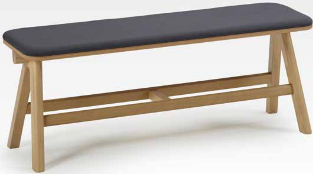
Banc Chevron Chêne et Tissu