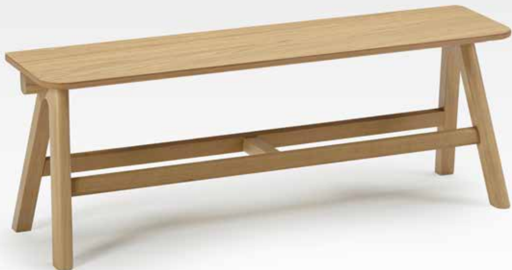
Banc Chevron Chêne blanchi