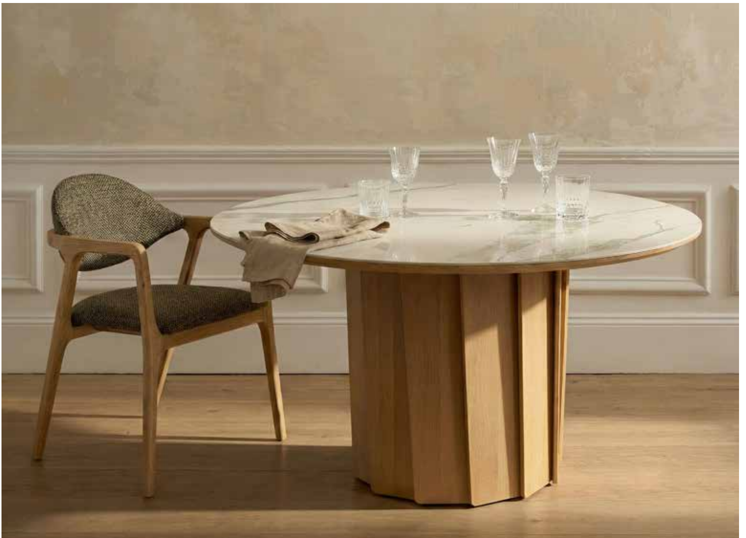
Table Volute Chêne blanchi et Céramique