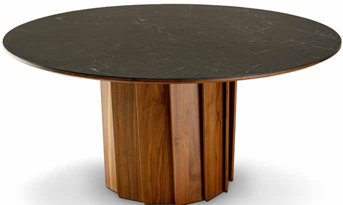
Table Volute Noyer et Céramique