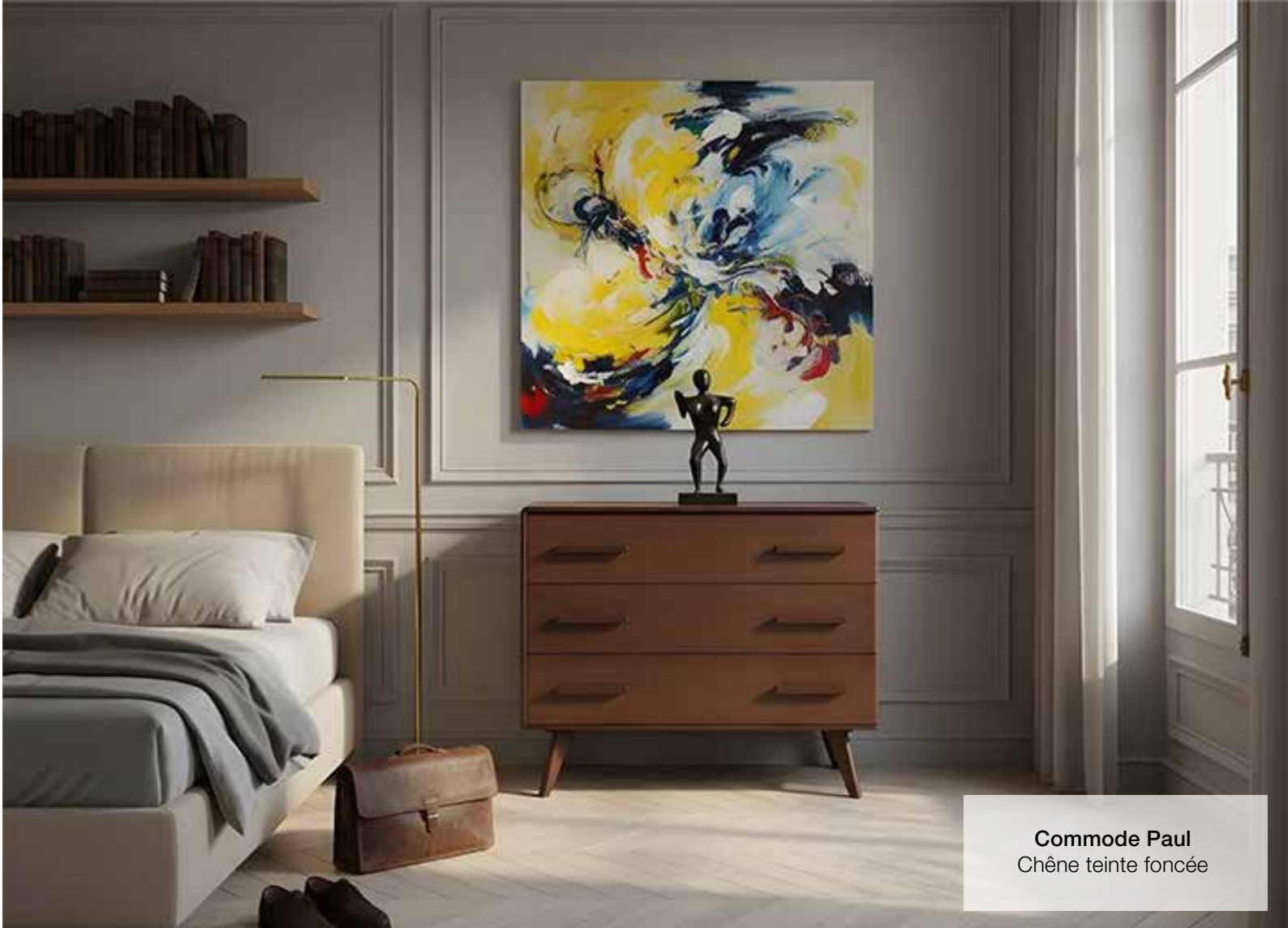
Commode Paul Chêne teinté foncée